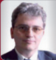
o. Univ.-Prof. Dr. Karollus Vorstand des Instituts für Unter- nehmensrecht Universität Linz

Die RECHT 2015 Tagung der ARS- Rechtswoche